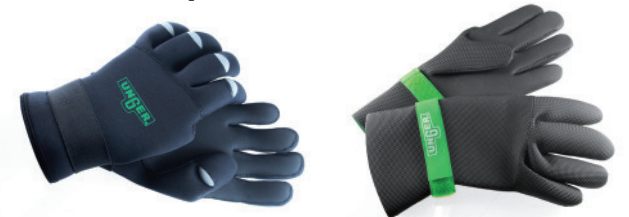
ERGOtec® NEOPREN HANDSCHUHE GLO2S, GLO2L, GLO2X, GLO2Z

Diese Größeninformation bezieht sich auf die NEUEN Unger Neopren und ErgoTec® Neopren Handschuhe.