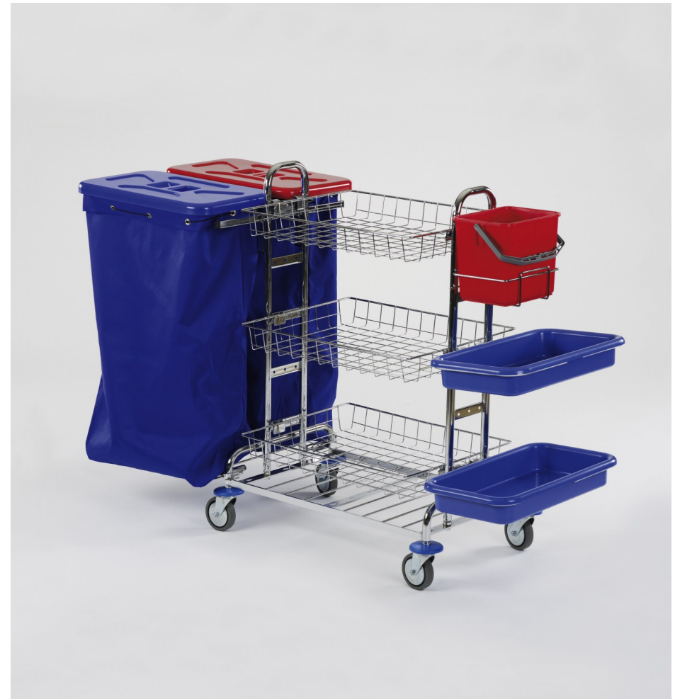
Deckel und Entsorgungssäcke sind Zubehör