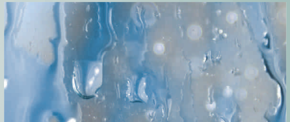
Herkömmliche Händedesinfektionsmittel haben durch die flüssige Konsistenz erhebliche Nachteile in der Handhabung.

Aufgrund der viskosen Konsistenz läuft es kaum aus der Hand; ein Tropfen auf den Boden wird so fast gänzlich vermieden. Die gelartige Struktur erleichtert eine genauere Dosierung, da weniger wegtropft. Durch diese exakte Dosierungsmöglichkeit wird eine nicht unerhebliche Ersparnis bei der Verwendung von Softa-Man® ViscoRub erreicht.