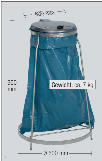
Abb.: MSTS 120, mit Kunststoffdeckel, silber, Art.Nr. 1026