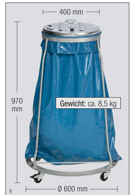
Abb.: MSTS 120, fahrbar, mit Metalldeckel, Art.-Nr. 10281

Zubehör: Kunststoffsock, 120-Ltr. Verpackungseinheit (VE) = 250 Stück