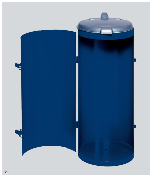
Abb.: Kompakt-Junior mit Einflügeltür, enzianblau beschichtet, Art.-Nr. 10161