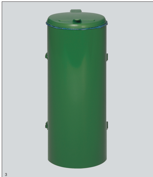
Abb.: Kompakt-Junior mit Einflügeltür, grün beschichtet, Art.-Nr. 1002

Der Kompakt-Junior mit Einflügeltür ist im Boden einfach gelocht. Bei Bedarf ist somit eine schnelle und diebstahlsichere Befestigung des Gerätes währleistet.