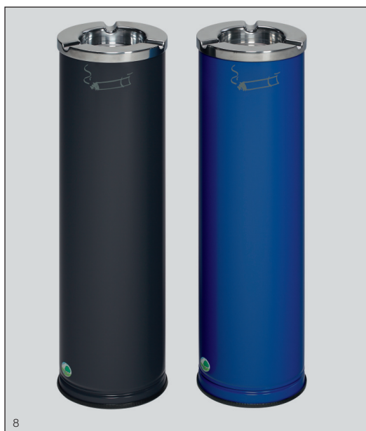
Abb.: Ascher D 20