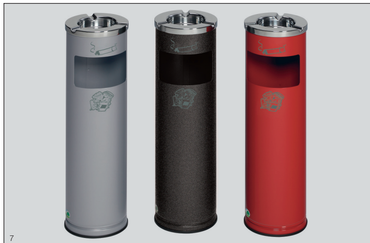
Abb.: Abfallsammler/Ascher D 20

Der hochwertige Aschereinsatz ist bei allen Geräten aus Aluminium gefertigt und poliert. Alle Ausführungen mit bodenschonendem Kantenschutz.