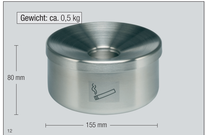
Abb.: Tisch-Ascher Typ B - Edelstahl, Art.-Nr. 3212