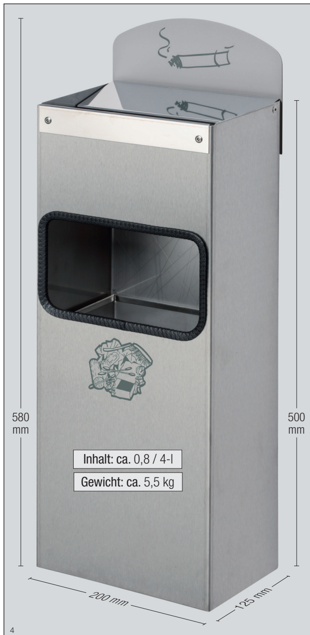
Wandascher WH 51, Edelstahl, mit Schild. Art.-Nr. 14983

Hinweisschild aus verzinktem Stahlblech, in silber – pulverbeschichtet. Lieferung inkl. Montagematerial zur Wandbefestigung und Piktogramm-Aufklebern.