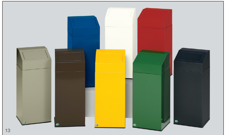
Abb.: Kompl. Entsorgungsstation bestehend aus je einem Wertstoffsammler 45 l für: Wertstoffe, Papier, Restmüll, Metall, Putztücher, Grün-Glas, Braun-Glas, Weiß-Glas.

Der zu jedem Gerät gehörende Inneneinsatz wird aus verzinktem Stahlblech gefertigt. Aus hygienischen Gründen ist der Einsatz von Kunststoffsäcken möglich. Für ein schnelles Entleeren des Inneneinsatzes wird das Kopfteil einfach angehoben.