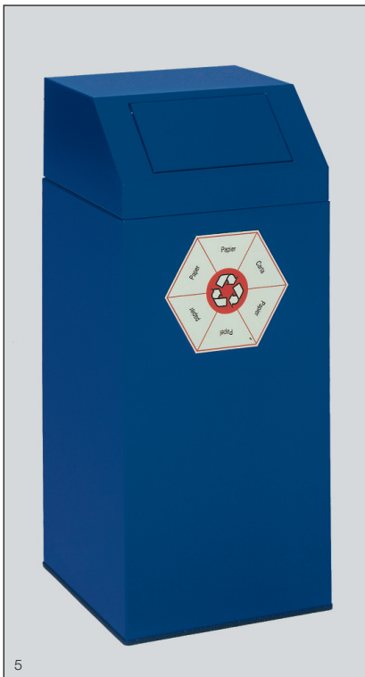
Abb.: Wertstoffsammler 76 l für Papier, Art.-Nr. 1243

Die Trennung der unterschiedlichen Wertstoffe erfolgt durch die verschiedenfarbige Beschichtung der Wertstoffsammler 45 l und 76 l sowie mit einem internationalen Aufkleber in 6 Sprachen (Deutsch, Englisch, Französisch, Italienisch, Spanisch, Niederländisch), der den zu entsorgenden Wertstoff bezeichnet.