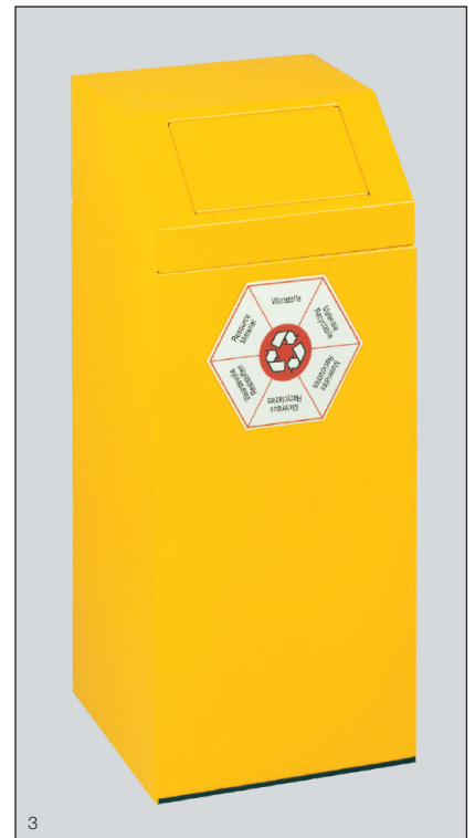
Abb.: Wertstoffsammler 76 l für Wertstoffe, Art.-Nr. 1244