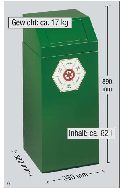
Abb.: Wertstoffsammler 76 l Grün-Glas, Art.-Nr. 1242