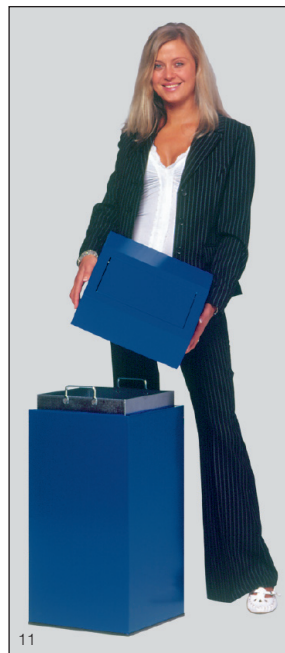
Abb.: Wertstoffsammler 76 l für Papier, Art.-Nr. 1243