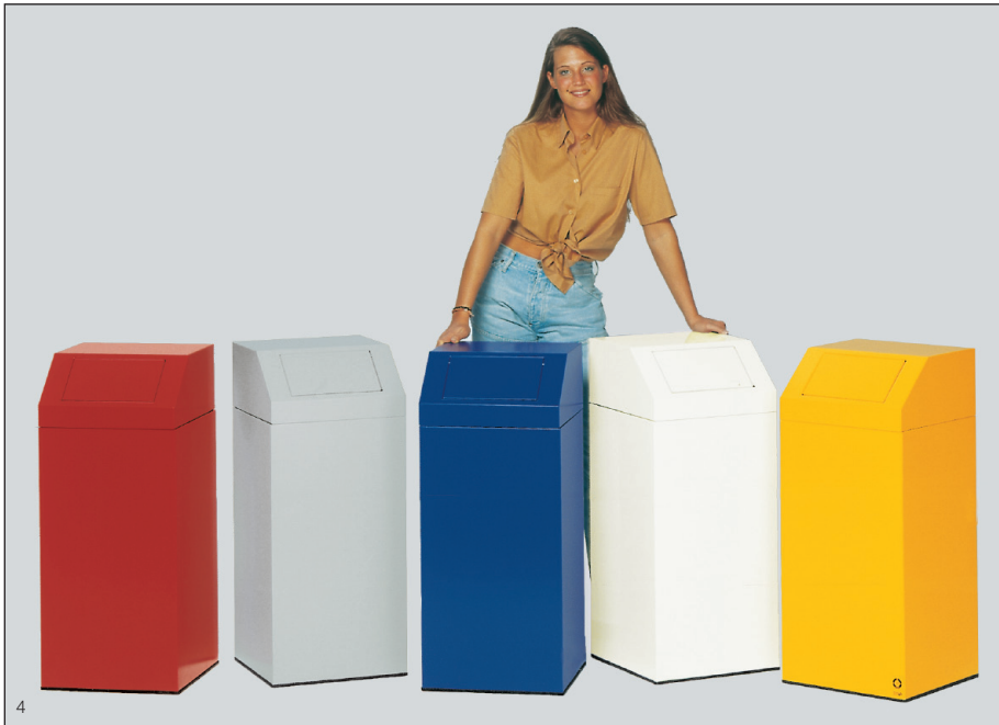
Abb.: Wertstoffsammler 76 l als Entsorgungsstation, bestehend aus je einem Gerät für: Putztücher, Restmüll, Papier, Weiß-Glas, Wertstoffe

Produktion überwacht und Sicherheit geprüft vom TÜV PRODUCT SERVICE