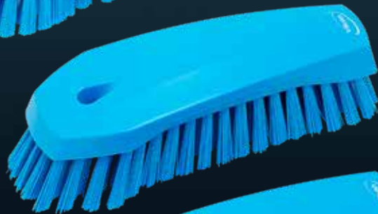
3587x Handbürste M