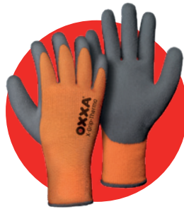
X-GRIP-THERMO 51-850 Art.-Nr. 1.51.850.00