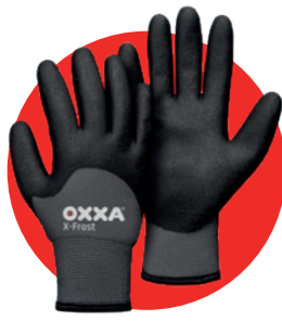
X-FROST 51-860 Art.-Nr. 1.51.860.00