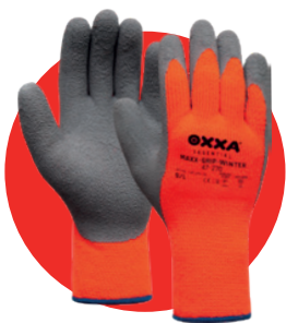
MAXX-GRIP-WINTER 47-270 Art.-Nr. 1.47.270.00