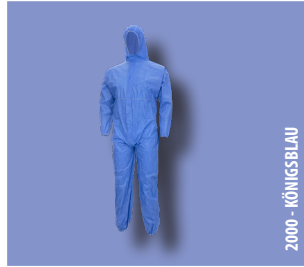
2000 - KÖNIGSBLAU