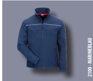
2100 - MARINEBLAU