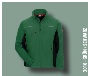
3010 - GRÜN / SCHWARZ