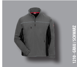
1210 - GRAU / SCHWARZ