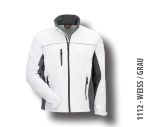
1112 - WEISS / GRAU