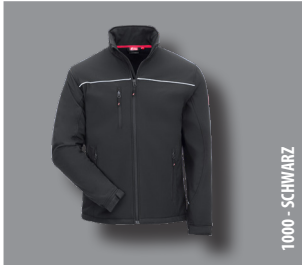
1000 - SCHWARZ