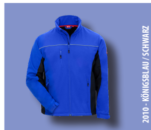
2010 - KÖNIGSBLAU / SCHWARZ