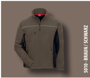
5010 - BRAUN / SCHWARZ