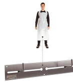
Art. 88936 Edelstahl stainless steel

Nur mit passendem Zubehör Only with suitable accessories