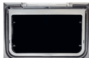
120 Liter Fassungsvermögen.