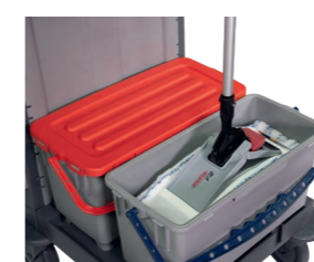
Hygienisch: Berührungsfreie Aufnahme durch optionalen V-Wing Klapphalter (S. 116).