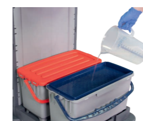
Optionale Tränkhilfe. Art.-Nr. 305.032 blau & 305.033 rot

6 Liter Eimer mit Henkel in Gelb + Deckel 305.027