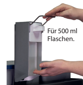
Für 500 ml Flaschen.