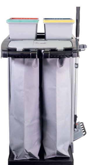
Optionaler Wäschesack klein. Art.-Nr. 304.025