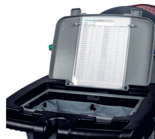
Praktische Auf- und Ablage für Reinigungspläne.