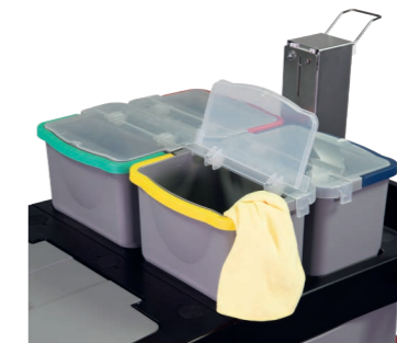
6 Liter Eimer mit transparentem Deckel.