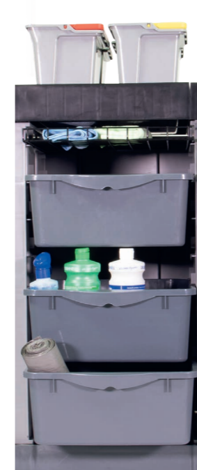
Maximales Ladevolumen. Umfangreiche Grundausstattung.