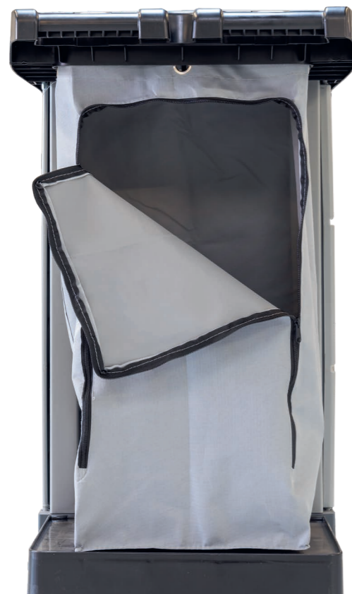
Wäsche oder Müll durch Reißverschluss leicht zu entnehmen.