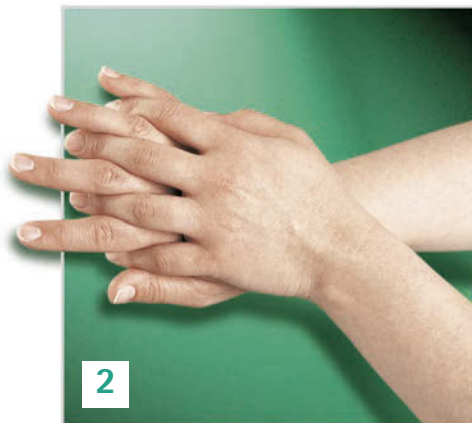
Rechte Handfläche über linkem Handrücken und linke Handfläche über rechtem Handrücken.