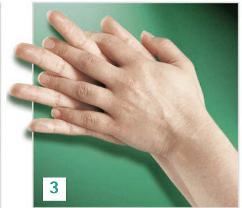
Handfläche auf Handfläche mit verschränkten gespreizten Fingern.