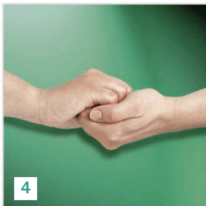
Außenseite der Finger auf gegenüberliegende Handflächen mit verschränkten Fingern.