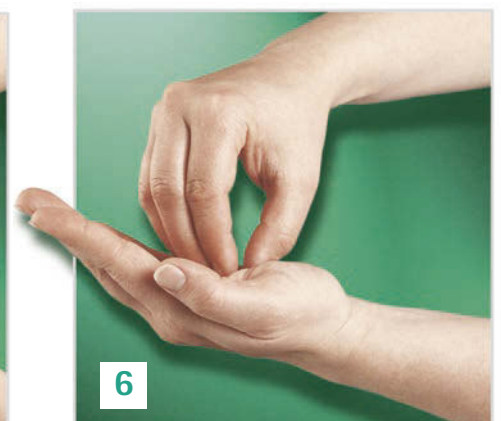
Kreisendes Reiben hin und her mit geschlossenen Fingerkuppen der rechten Hand in der linken Handfläche und umgekehrt.

Desinfektionsmittel in die hohlen, trockenen Hände geben. Nach dem oben auf geführten Verfahren das Produkt in die Hände bis zu den Handgelenken kräftig einreiben. Empfohlene Einwirkzeit des jeweiligen Produktes beachten.