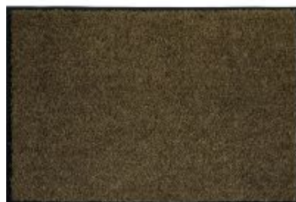
Proper Tex Uni - anthrazit-braun | 042