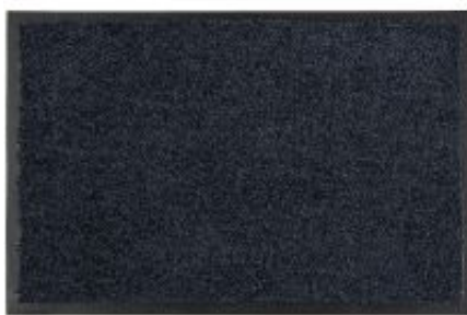
Proper Tex Uni - schwarz | 044