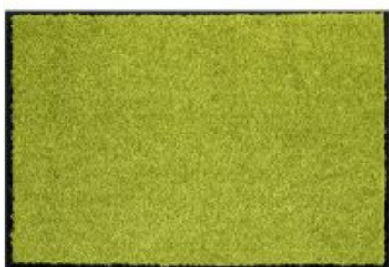
Proper Tex Uni - grün | 030