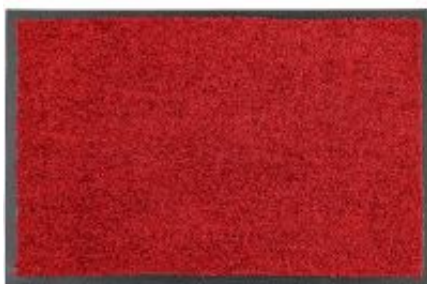
Proper Tex Uni - rot | 011