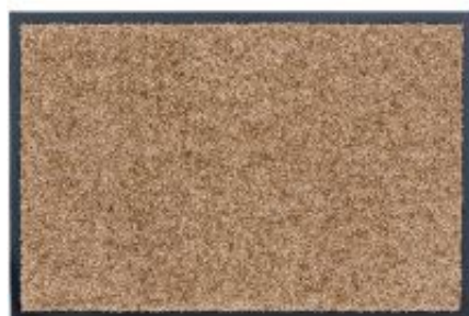
Proper Tex Uni - sand | 006