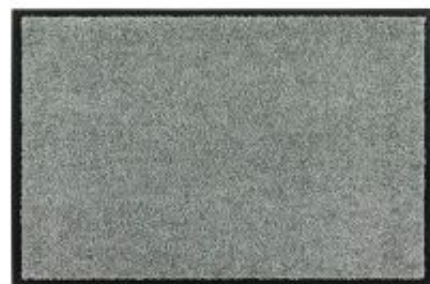
Proper Tex Uni - mint | 022