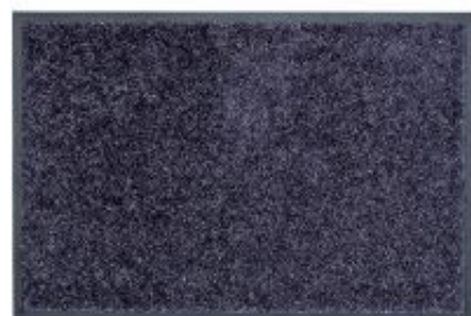
Proper Tex Uni - blaugrau | 041