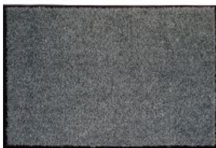
Proper Tex Uni - grau | 040