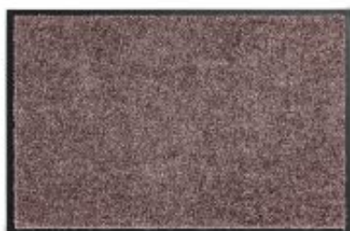
Proper Tex Uni - blush | 017