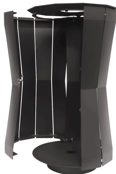
Abb.: 7098-00 in RAL 7021 geöffnet