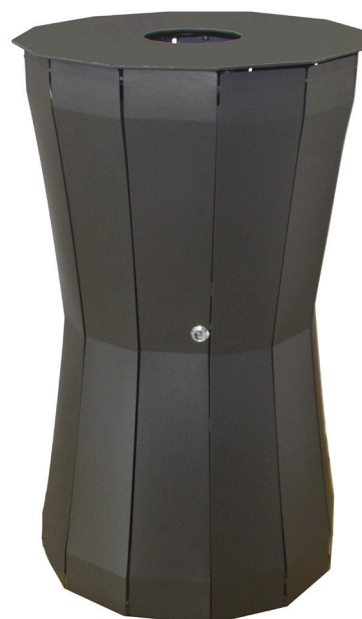
Abb.: 7098-00 in RAL 7021