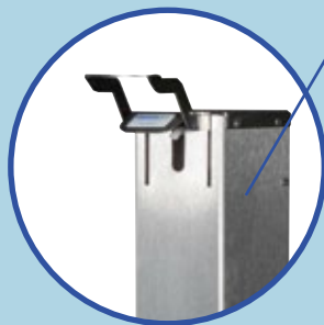
Integrierter Desinfektionsdispenser ALL-IN-ONE-System