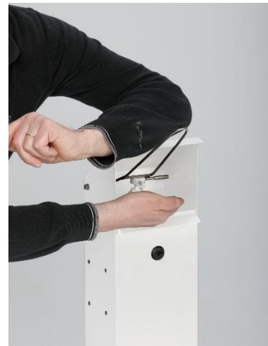
Abb. Bedienung des Handdesinfektionsspenders