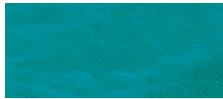
petrol | 54