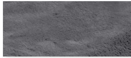
anthrazit | 91