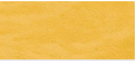
gelb | 12