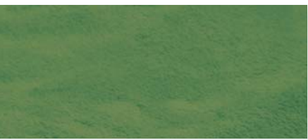
dunkelgrün | 85