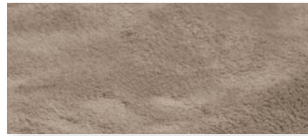
taupe | 71