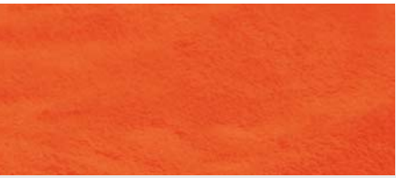
karminrot | 30