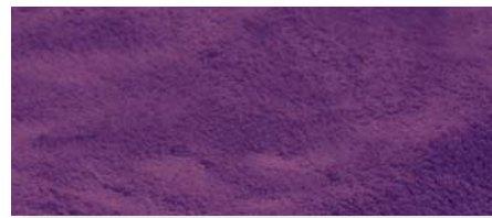
dunkellila | 38