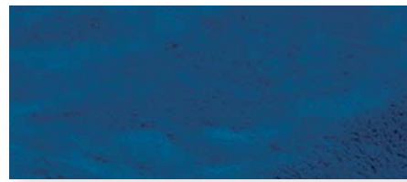
marineblau | 50