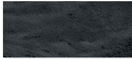
schwarz | 94