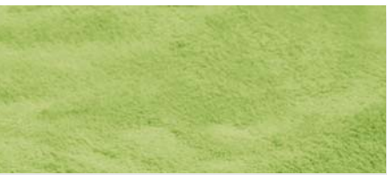
grün | 80