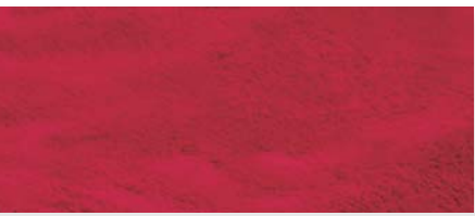
rot | 37