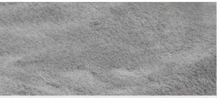
silber | 90