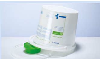
Reinigung, Desinfektion & Trocknung