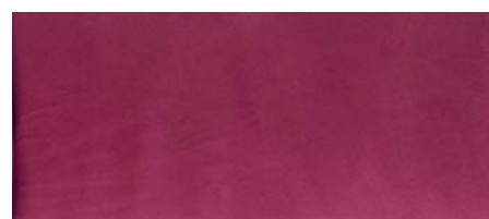
bordeaux | 33