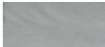
silber | 90