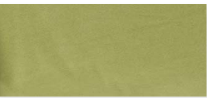
limonengrün | 80