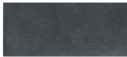
anthrazit | 91