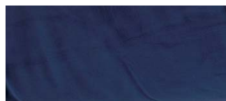
dunkelblau | 51